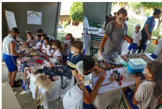
Figura 10: Envolvimento da comunidade escola, discentes e funcionários observando e comprado