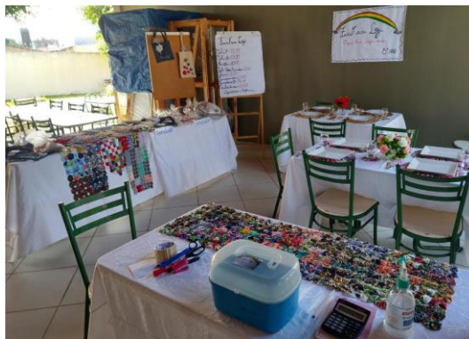
Figura 1. Fuxikeira Loja

Esta experiência foi motivada a partir das formações das redes de vivências, promovida pelo Sesc. Os educadores aprofundaram os conhecimentos sobre a temática Educação Financeira e partir desse aprofundamento, consideramos importante abordar com os estudantes. Com a turma do 5º ano, foi construído a ideia de montar uma loja com peças de artesanato local, o “fuxico”. Os alunos se envolveram com a interação da família e iniciaram a confecção dos artefatos para serem comercializadas, surgindo a “Fuxikeira Loja”, como apresenta a figura 1.