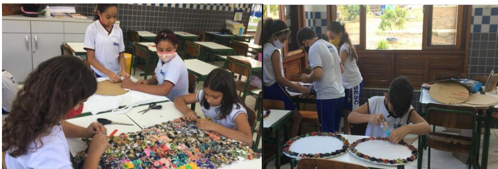
Figura 2. Trabalhos manuais – aplicação de fuxico em passadeira e sousplat