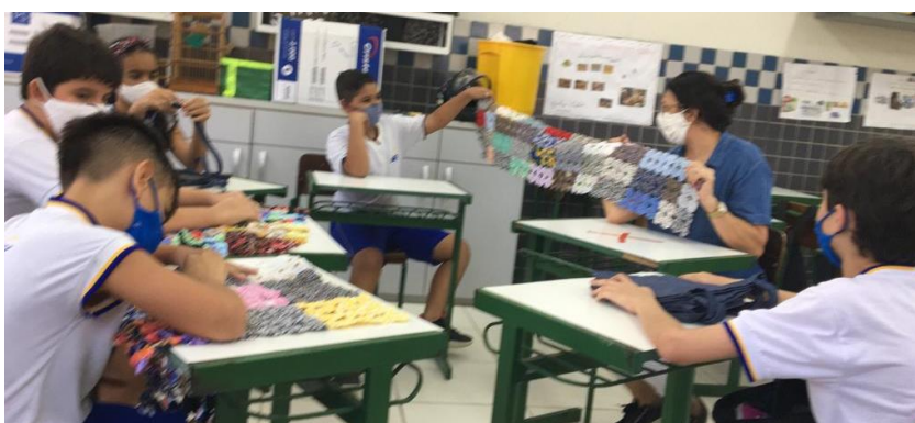
Figura 11. Envolvimento da turma, para confecção das peças com aplicação do fuxico

Trabalhos manuais é algo que custa tempo e disponibilidade para serem confeccionados (figura 11), essa foi a maior dificuldade encontrada, já que o tempo para produção dos fuxicos e consequentemente a produção dos objetos precisava ser contextualizada com o currículo escolar, pois tudo foi trabalhado em sala de aula, sendo necessária contactar o planejamento de ensino e os trabalhos para a loja.