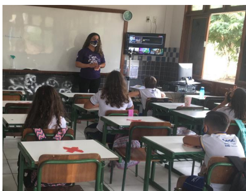
Figura 8: Funcionária da Central de Relacionamento e Negócios, esclarecendo a logística da aplicação do capital da unidade (aula em formato presencial e remota)

A Matemática Financeira conecta com o cotidiano das pessoas. Por isso foi proporcionado a importância de produzir e comercializar objetos como tiaras, bolsas, passadeiras, entre outros produtos que culminou na criação da “Fuxiqueira Loja”, do qual foi impactante em vários aspectos desde a instituição, comunidade docente, discente e familiar (figura 9 e 10). Tivemos a parceria da família nas produções e na gravação da propaganda da loja. (vídeo 1).