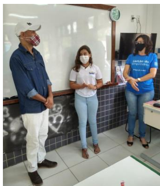
Figura 5: Aula presencial e online ao vivo, pelo aplicativo Zoom - Bate papo com artesão do bairro