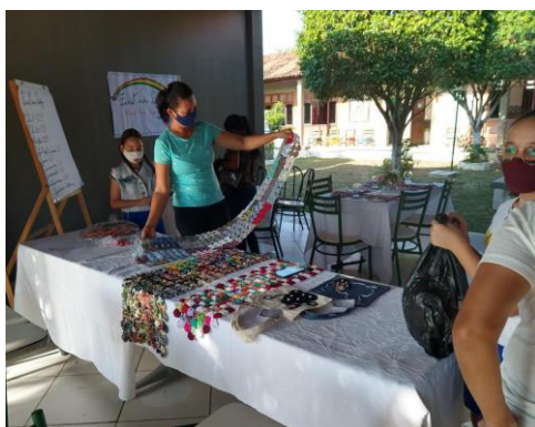
Figura 9: Familiares dos alunos observando e comprando as peças confeccionadas

A Matemática Financeira conecta com o cotidiano das pessoas. Por isso foi proporcionado a importância de produzir e comercializar objetos como tiaras, bolsas, passadeiras, entre outros produtos que culminou na criação da “Fuxiqueira Loja”, do qual foi impactante em vários aspectos desde a instituição, comunidade docente, discente e familiar (figura 9 e 10). Tivemos a parceria da família nas produções e na gravação da propaganda da loja. (vídeo 1).