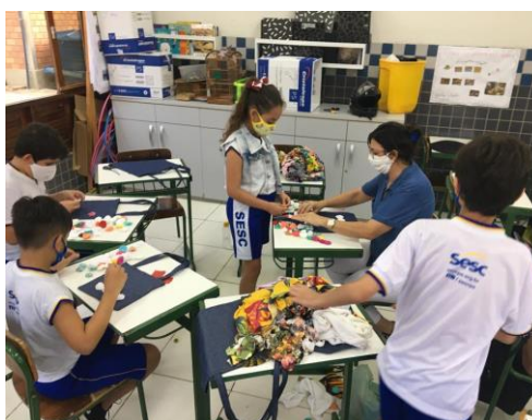
Figura 3. Trabalhos manuais – aplicações de fuxicos em bolsas

A Educação financeira e a arte do fuxico se intercalaram no auxílio da aprendizagem. Enquanto a educação financeira, envolve uma série de questões sobre o sistema monetário, como identificação de valores de cédulas, moedas e atividades envolvendo compras e vendas, (PROPOSTA PEDAGÓGICA, 2015). A cultura, se enquadra na Arte proporcionando a valorização da estética, desenvolvendo o sentido de trabalho em equipe, assim como exploração da coordenação motora e da criatividade. Tema e habilidades importantes a serem integradas no âmbito escolar.