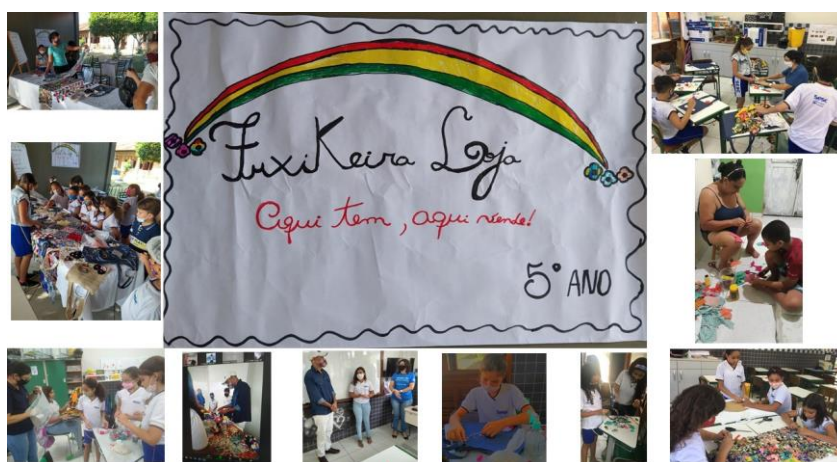
Vídeo 1: Propaganda Fuxiqueira Loja