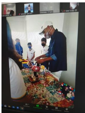
Figura 6: Exposição de peças artesanais