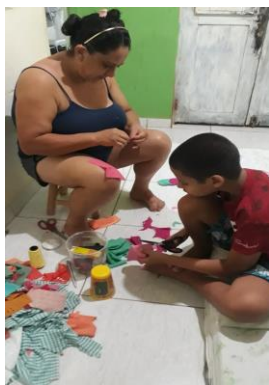
Figura 7: Confecção de fuxicos, com auxílio do responsável